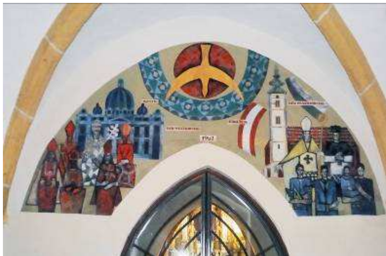
Das Bild im Eingangsbereich der Turmhalle

Als man 1995 u.a. die Sanierung der unteren, feuchten Bereiche der Pfarrkirche in Angriff nahm, traten völlig unerwartet in einer tieferen Putzschicht spätgotische Fresken von hoher Qualität zu Tage. Sie wurden 2000 freigelegt. Rechts des Kirchenportals wird die Darstellung einer Beweinung Christi gezeigt, links dürfte es sich um Szenen aus dem Buch Ijob handeln.