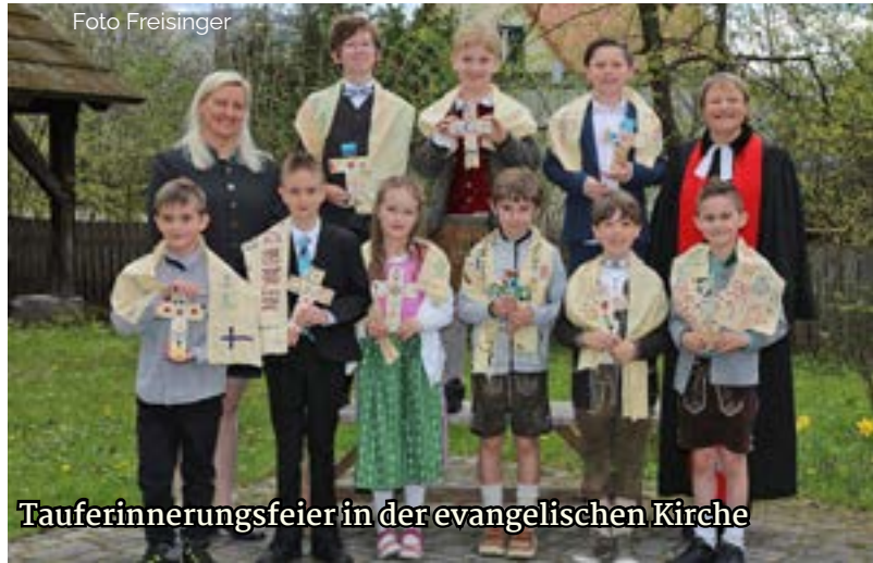
Tauferinnerungsfeier in der evangelischen Kirche