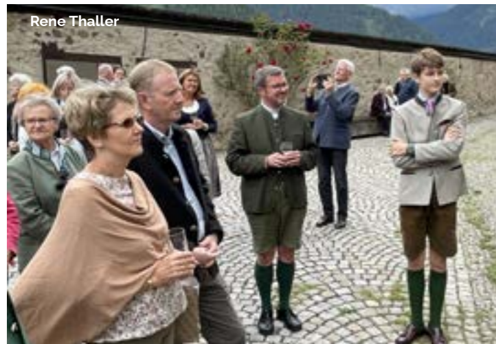
Begegnung nach der heiligen Messe in Eisenerz