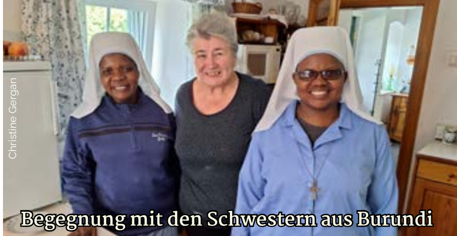
Begegnung mit den Schwestern aus Burundi