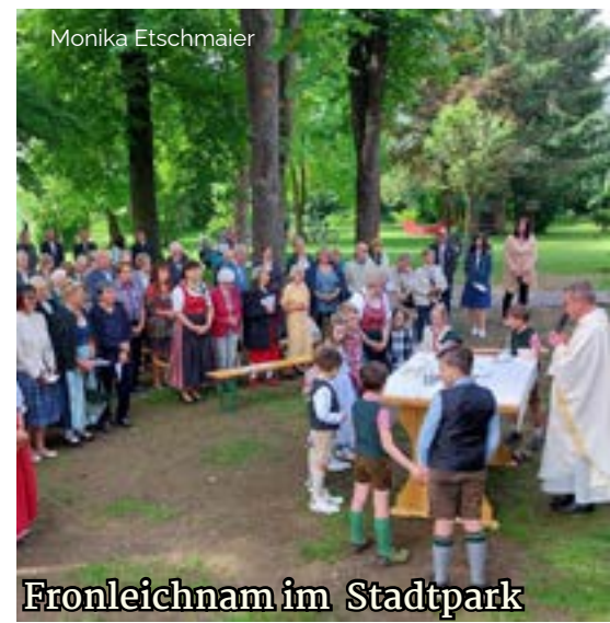
Fronleichnam im Stadtpark