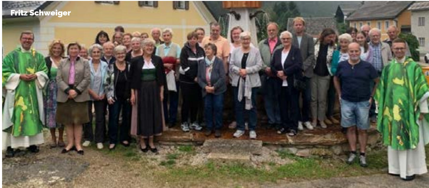
Begrüßung von Pfarrer und Kaplan nach der ersten heiligen Messe in Radmer