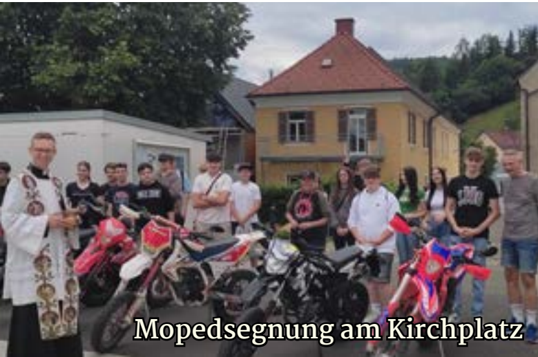
Mopedsegnung am Kirchplatz