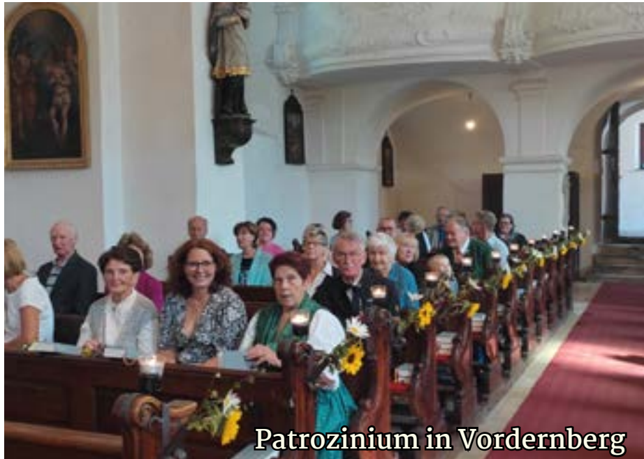
Patrozinium in Vordernberg