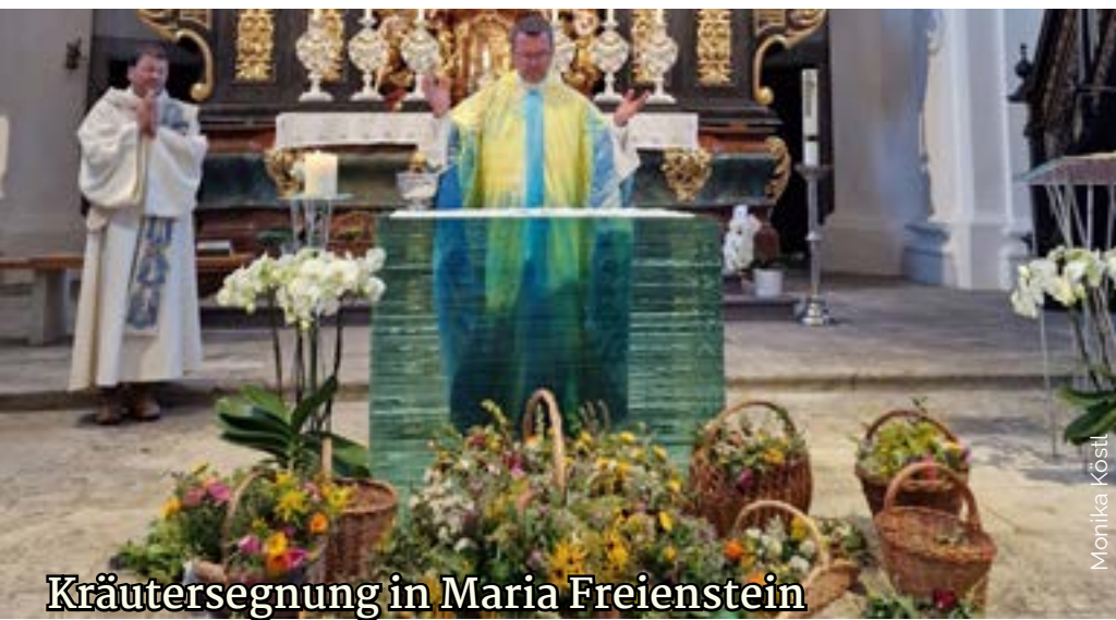
Kräutersegnung in Maria Freienstein