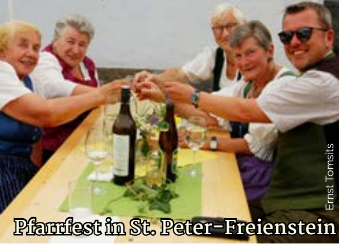
Pfarrfest in St. Peter-Freienstein