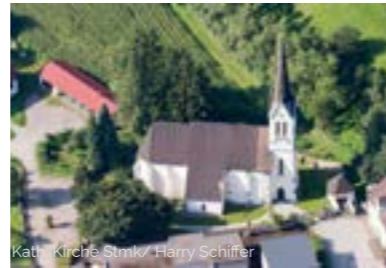
Kath. Kirche Stmk / Harry Schiffer