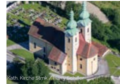
Kath. Kirche Stmk / Harry Schiffer

Sonntag, 16.02., 09:00 HL. Messe mit ErstkommunionSTART, anschl. Pfarr- café